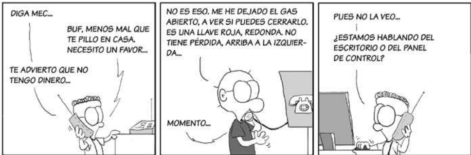
TIRA ECOL - JAVIER MALONDA