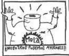
¿POSO TROB PODEMOS AYUDARLE!!

¿CÓMO DAVIDA NO SE HA INCORPORADO A LA MODERNA Y MOLONA SOCIEDAD INDUSTRIAL? ¿NO TIENE AUN SU DIVERTIDO DANCER? ¿NO SE HA CONVERTIDO EN UN SIMPÁTICO Y ENAJENADO NÚMERO? ¿QUE HACE QUE NO SE ENCAMINA HACIA EL MEGACHACHI MUNDO TECNOLÓGICO INDUSTRIAL?