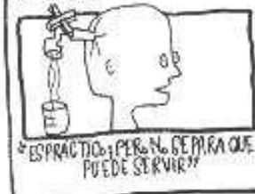
¿ES PRACTICO? PERO NO SE PARA QUE PUEDE SERVIR??

SEGUN HE PODIDO SABER SU DESARRULL YA HA SIDO ULTIMADO, Y PRANTO PODRIA ESTANDARIZAR SE SU USO.