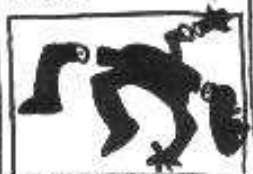
UNA MANERA DE ALTA VELOCIDAD NO?

OVERTAMENTE, DEBEMOS RECONOCER LAS VENTAJAS DE LA ALTA VELOCIDAD QUE NOS PERMITE UNA ALICADA HUIDA DE LA CIUDAD CON TAN EFICIENTE PRISA Y SIN QUE TENGAMOS QUE CONTEMPLAR A TRAVÉS DE LA VENTANILLA DEL COMPLEJO ARTEFACTO CON EL QUE NOS DESPLAZAMOS EL PAISAJE DESTRUIDO Y LOS PEQUEÑOS HOMOGENEIZADOS DIARIOS, PARA CAER FINALMENTE EN LA MEGACIDAD. PERO ES SI, SIN DESTINARLOS JAMÁS.