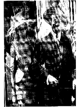
En esta la hija de Aznar: El Jose Mari ya ha invitado a la BODA ALTERNATIVA EN EL PARQUE DE LA DISPUTADA CORNISA (Sábado 7 de Septiembre, 2002, 18h. Ir prescindiendo de pamea y bigote). Ceremonia, desfile y sorteo viaje de novios a Isla Perejil