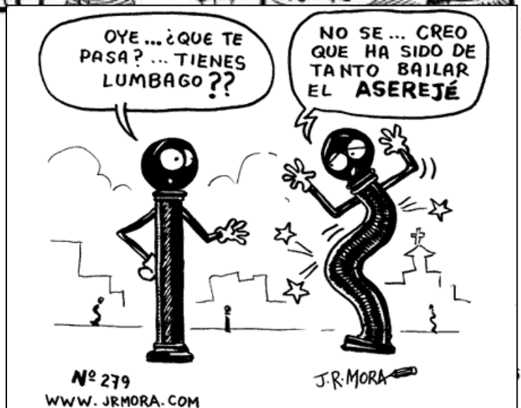
Nº 279 WWW.JRMORA.COM

Vuelvo para contaros que hay 12 nuevas tiras de Moqui en la web esta vez la 204-205 y del 218 al 213 (12 nuevas en total) y que además estamos intentando añadir nuevas tiras en las que podáis proponer vuestras ideas o añadir personajes. Las colaboraciones en las tiras en las que queráis participar irán firmadas por vosotros podeis enviar las propuestas a info@jrmora.com . Añadir un nuevo personaje...inventar una nueva situación de