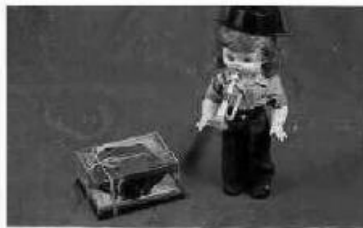
BABY MULTITAS Toca la corneta y pide la documentación. Incluye tricorno despertador de regalo. 5.999