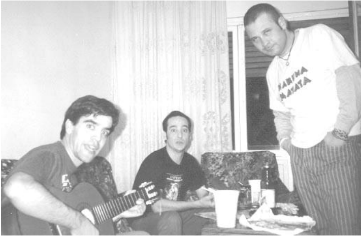
Los Chichos, con un sorprendido en tol medio.