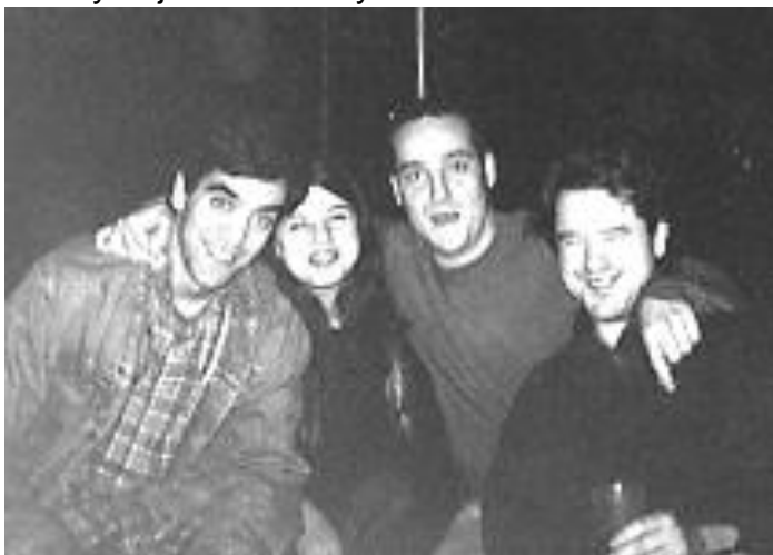
El Cuarteto de la Habana, aún felices los pobrecillos.