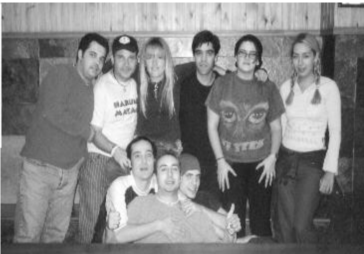
La descojonante reunión Leprosa de Murcia (15 de Octubre)