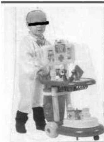
CARRITO TEST DE LA ALCOHOLEMIA Métale al crío el miedo a la bebida 3.449