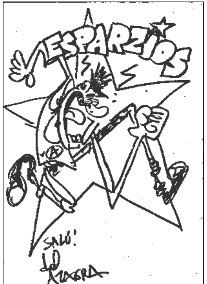
Otro dibujo de Azagra de la la Exposición de la CGT del 24 de nov. Está dedicada a los Esparzíos: Punk, Rock... o algo