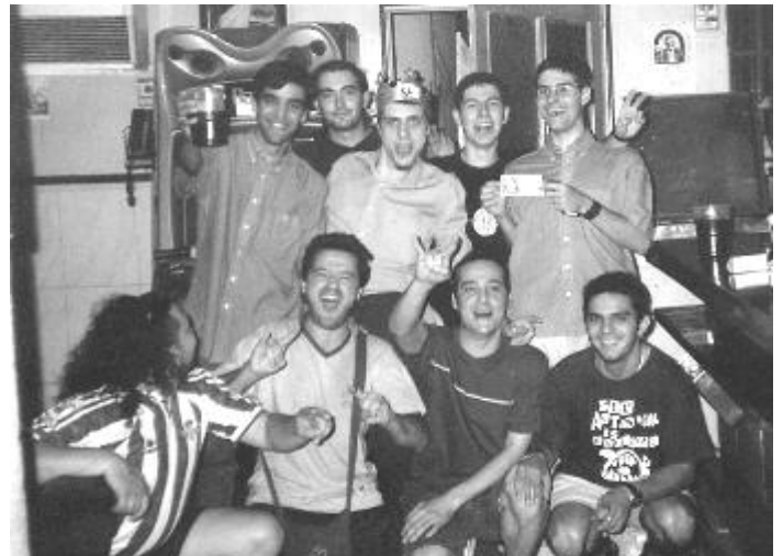
La étfica reunión Leprosa de Madriz (4 de Agosto)