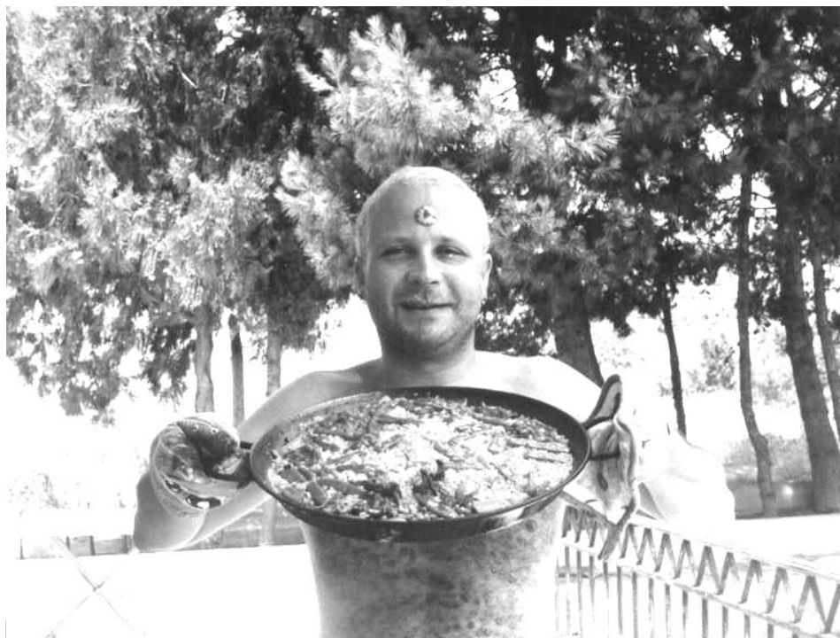
El Komandante Zirkope tan contento con su paña. A ver si se acerca a un Derby de los de febrero y se curra una con Pinchos por su cumple. Le salen ALUCINANTES.

Y fue así como esta gentuza se embarcó en la aventura del maravilloso mundo del fanzine. Y conocieron gente de putísima madre (y auténtic@s hij@s de puta) por toda la península y parte del extranjero, e hicieron intercambio de ideas, proyectos, ilusiones, dibujicos, mala leche, drogas, alcohol, sexo, enfermedades venéreas, juergas descontroladas, etc., etc., etc. Y como todo pasa y nada queda y lo nuestro es pasar, dejando tras nuestro paso una estela de tranquilidad aunque el vino sea