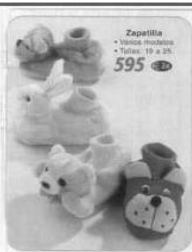
PATUCOS 'ATRAE PERROS' Zapatilla • Varios modelos • Tallas: 19 a 25 595 € Póngaselos a su bebé y verá como se queda sin piernas. 759