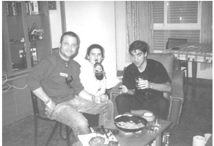
Akabando con las migas. Si es que no dejáis ná de ná.