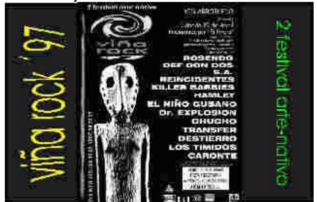
Cartel de la edición del año pasado

Esta vez la afluencia de publico fue mayor y de mas lugares de la península. Concretamente probamos el "burret" (bebida a base de café y alcohol) que nos ofrecieron unos alicantinos, el "has" que se puede pillar en Barna hoy por hoy (mejor de lo esperado) y unas gachas manchegas deliciosas. Nosotros, a nuestra vez, pudimos ofrecer nuestro vino embocado o nuestras deliciosas patatas con costillas. La mezcla de culturas es lo mejor de estos festivales.