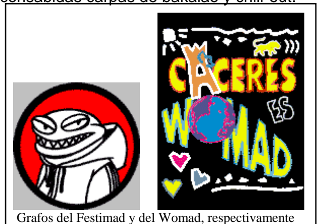
Grafos del Festimad y del Womad, respectivamente

Cambiando al mes de Mayo, tendremos en Mostoles durante el primer finde semana de dicho mes el Festimad'98 con Motorhead y unos tales Dover como mejor opción musical con las consabidas carpas de bakalao y chill-out.