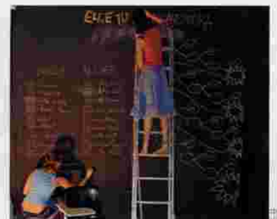
Presentación de los penegramas.