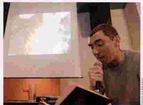
Lectura pornoclásica en LaDinamo de Lavapiés.

¿Te ponen más los Teletubbies que Nacho Vidal? Guiados por la lengua del Padrecito, mulá espiritual del grupo, Pornolab nace del hastío pornográfico de hoy en día presentando un único antídoto posible: imaginación y acción revolucionaria. Inició su andadura, el pasado julio, en el Centro Cultural Conde Duque de Madrid y en centros okupas como el Labo3. En el Pornoduque acogió todo tipo de actividades relacionadas con la experimentación social: talleres colectivos de cunnilingus, de dildos caseros, de depilación genital, pornojockeys, debates sobre porno femenino, juegos de elige tu propia aventura sexual, como los penegramas... Todo bajo la base de «nos cabe todo, nada de apropiarse del porno», dicen en Pornolab. Improvisación, humor, sin doctrinas, tan sólo suculentos bondages (práctica sadomasoquista) al discurso plano de la pornografía capitalista, los primeros jueves de cada mes, en el centro Ladinamo de Lavapiés. «A ver si se estira», dicen. En definitiva, la verdadera vía del Tao Cho Chin, para hablar, ver, degustar, sin pelos en la lengua, porque vale más un gemido que mil palabras en www.pornolab.org