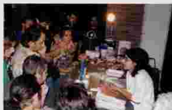
Taller de dildos caseros.