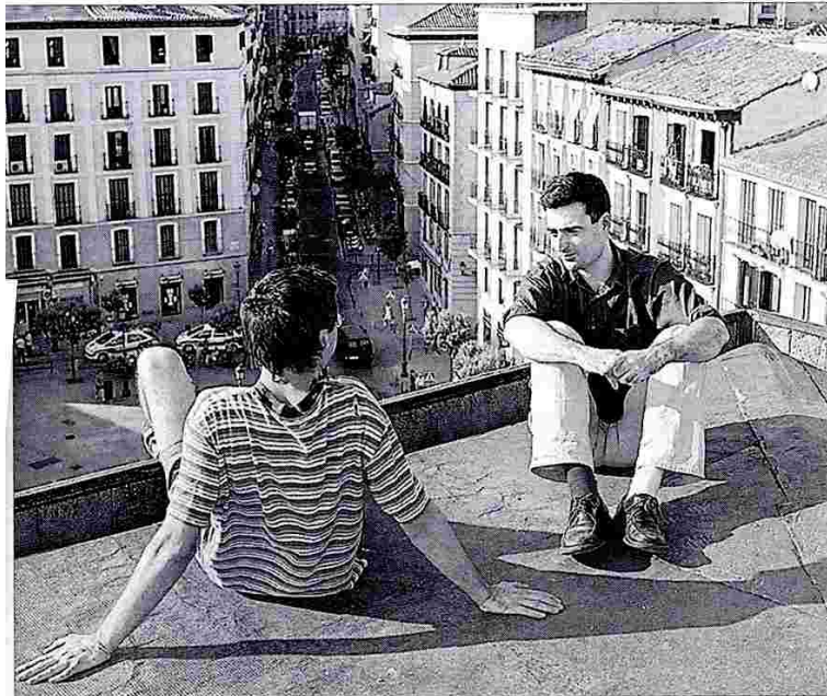
Dos componentes de La Fiambrera Obrera, en una azotea del barrio de Lavapiés.