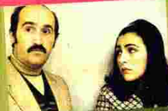
Torremalinas 73 trata el destape.

Clasificación S → En 1978-1979 apareció la clasificación nacional de filme S, que incluía películas en donde se simula el acto