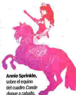
Annie Sprinkle, sobre el equino del cuadro Conde duque a caballo .

Los talleres apuestan por el porno femenino y otros modelos de convivencia amorosa. El porno hecho por mujeres, y no para mujeres, tiene su máxima expresión en directoras como la feminista francesa Ovidie, Angela Tiger y su película El perfume del deseo , la estadounidense Annie Sprinkle o, en España, Sandra Uve. «Es un cine más natural o artístico, menos grotesco. No se trata de una nueva sensibilidad, la diferencia se encuentra en