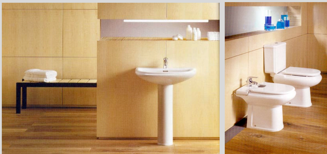
Alguno de los modelos de Sanitarios y Griferías que instalamos.