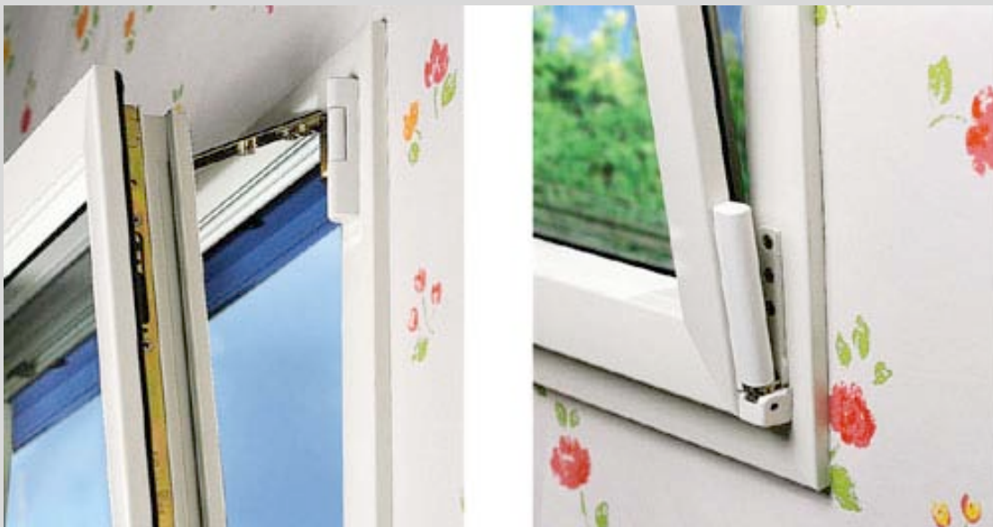
Carpinterías exteriores con rotura de puente térmico