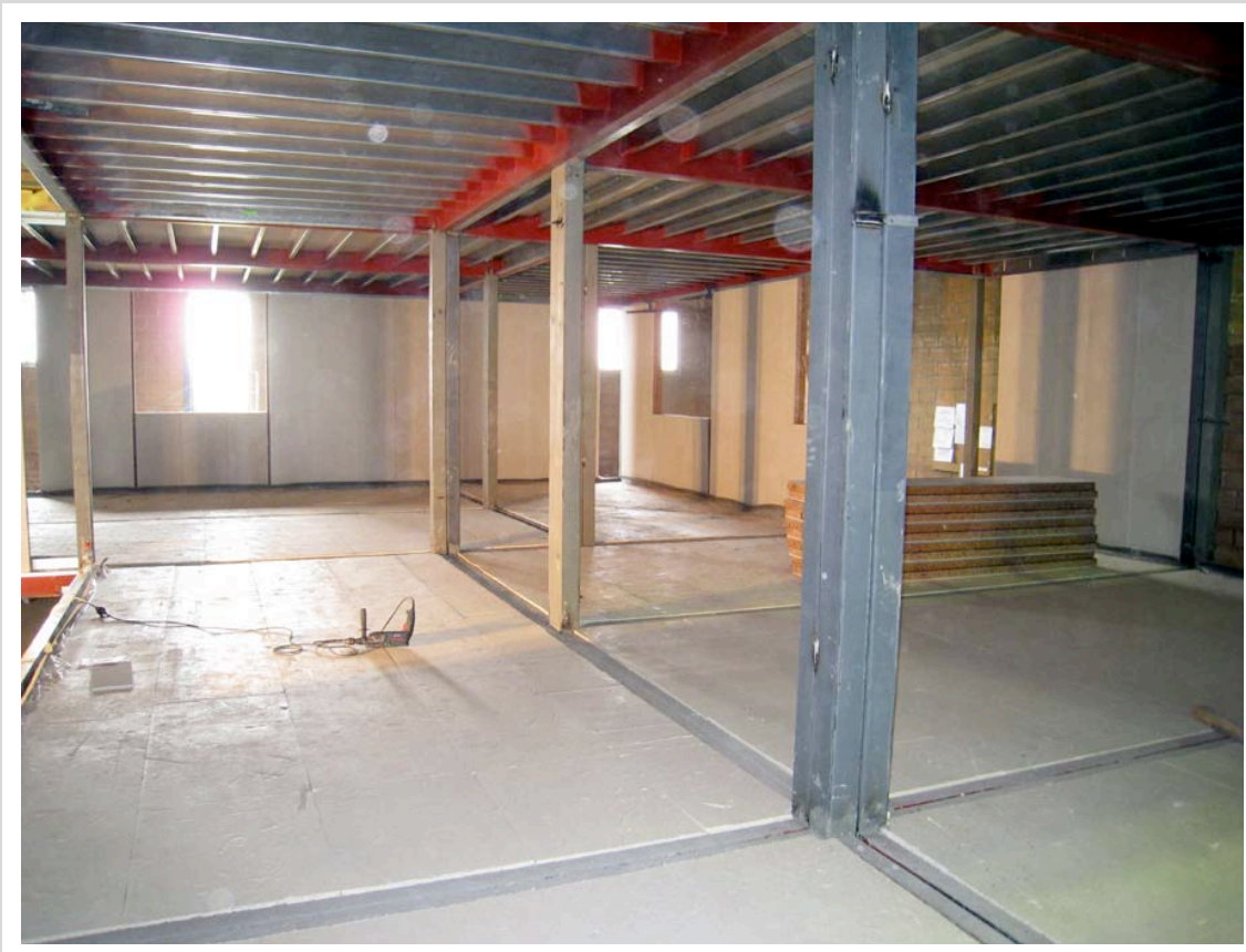
Estructuras de acero para nuestros módulos de 3x6x3,30 metros

Estructura de acero tratada consistente en UP's de 200, pilares de 120x120x3 y chapa de acero colaborante para elaboración de forjado.