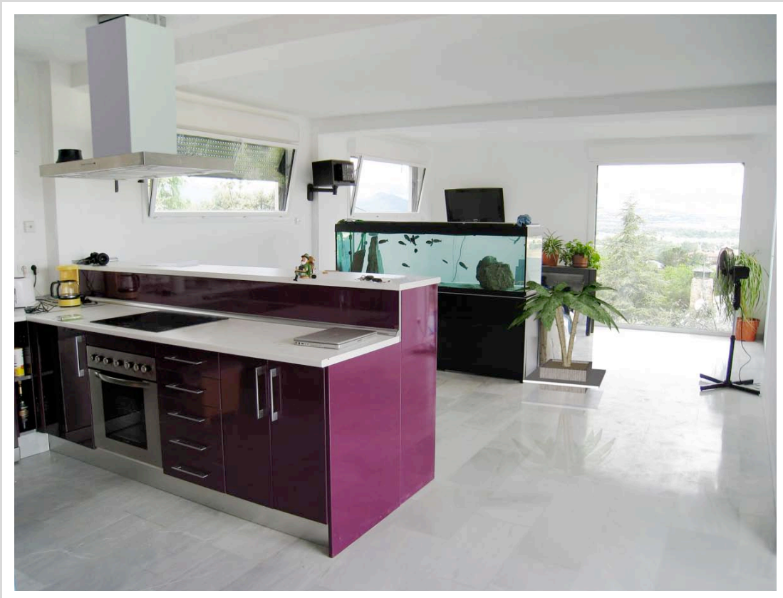
Suelos en una de nuestra casas.