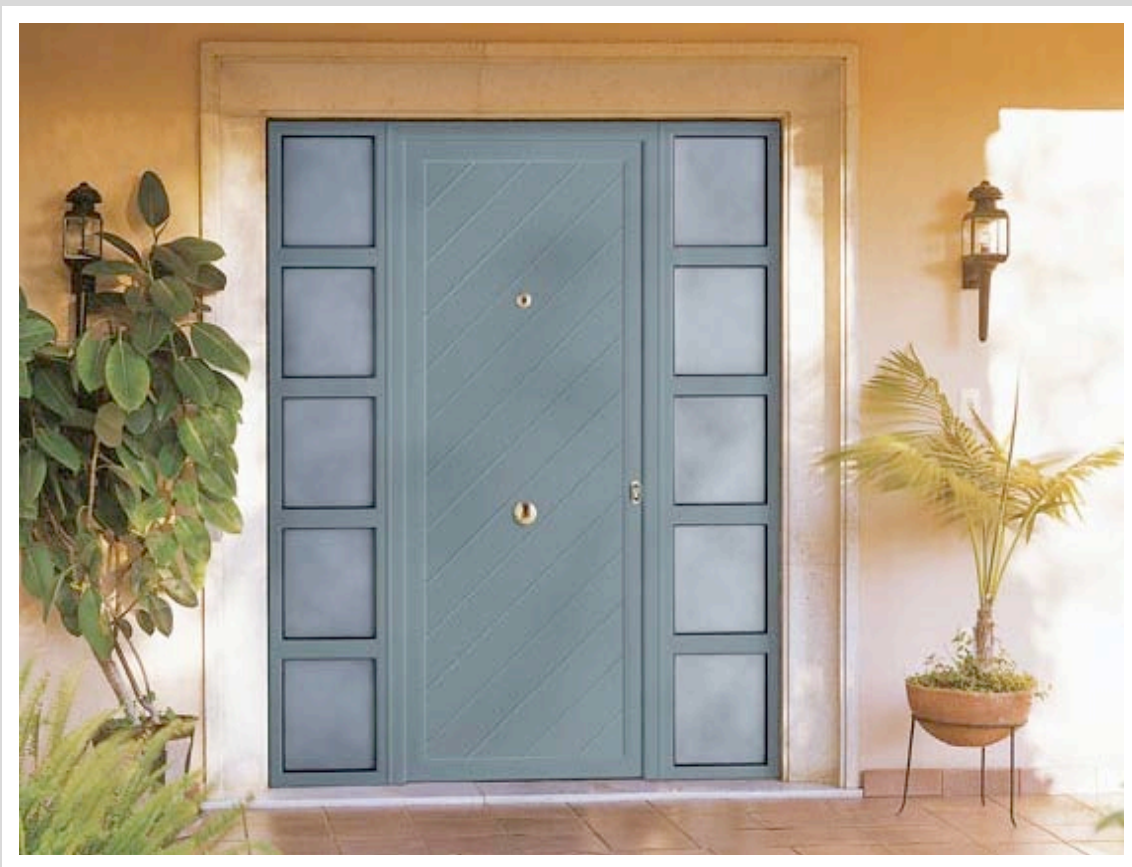
Puerta exterior de aluminio blindada