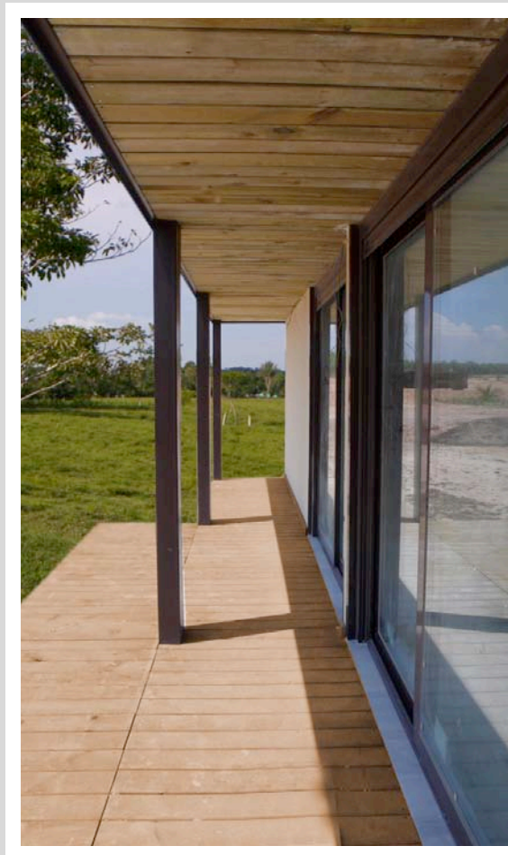
Pavimentos exteriores de madera

Pavimento de zona de porche en madera de pino de crecimiento lento tratada en autoclave.